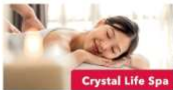
Crystal Life Spa