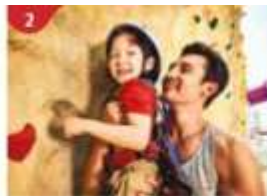
2 Rock Climbing Wall Challenge yourself on our mountainous rock climbing wall.