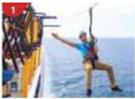
1 Ropes Course & Zipline Feel the thrill of gliding above the ocean on a 35-metre zipline.