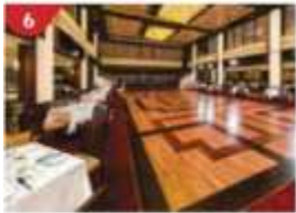
6 Dream Dining Room Savour a wide variety of Asian and International cuisine.