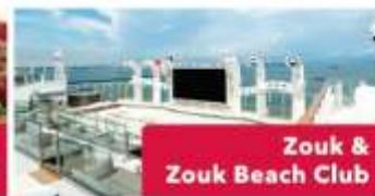
Zouk & Zouk Beach Club