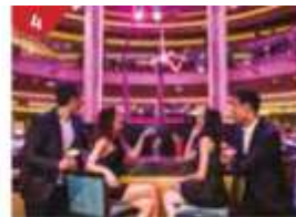
4 Bar 360 Catch live music and aerial acrobatic performances with a glass of champagne.