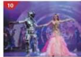
10 Zodiac Theatre Enjoy live production shows from the acclaimed award-winning entertainment team.