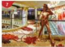
7 Johnnie Walker House™ Immerse yourself in the intricate world of premium Scotch whisky.