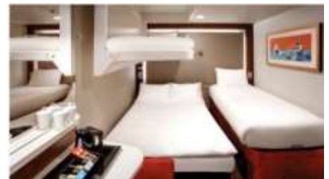
พัก 3-4 ท่าน