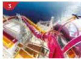
3 Waterslide Park Get drenched in fun on one of our six different waterslides.