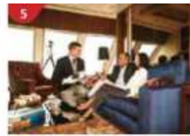
5 The Palace Indulge in European-style buffet service and exclusive facilities.