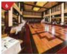
6 Dream Dining Room Savour a wide variety of Asian and international cuisine.