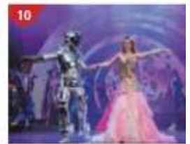
10 Zodiac Theatre Enjoy live production shows from the acclaimed award-winning entertainment team.