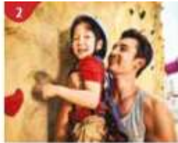
2 Rock Climbing Wall Challenge yourself on our mountainous rock climbing wall.