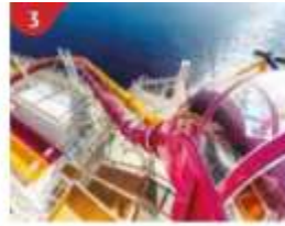
3 Waterslide Park Get drenched in fun on one of our six different waterslides.