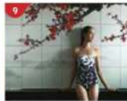
9 Crystal Life™ Spa Rejuvenate mind, body and soul with our holistic Western and Asian spa experience.