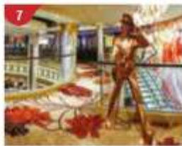
7 Johnnie Walker House™ Immerse yourself in the intricate world of premium Scotch whisky.