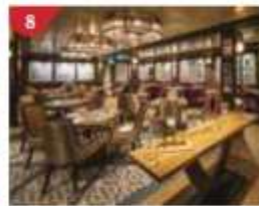
8 Bistro By Mark Best Relish contemporary Western cuisine from the internationally-acclaimed Australian chef.