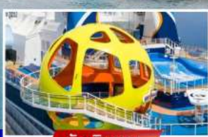
วันเดินทาง