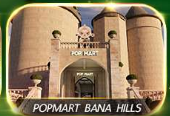
POP MART BANA HILLS

สัมผัสความงามหมู่บ้านฝรั่งเศสที่บานาฮิลล์ ซ้อปปิ้ง POPMART เยือนเมืองโบราณฮอยอัน ล่องเรือกระดิง วัดหลินอึ้ง สะพานมังกร