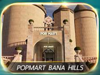
POP MART BANA HILLS

สัมผัสความงามหมู่บ้านฝรั่งเศสที่บานาฮิลล์ ซอปปิง POPMART เยือนเมืองโบราณฮอยอัน ล่องเรือกระดิง วัดหลินอึ้ง สะพานมังกร