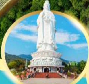
วัดหลิ่งอิ่ง