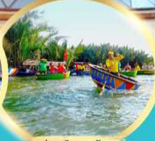
ล่องเรือกระดังง์