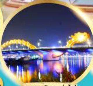
สะพานมังกรพ่นไฟ