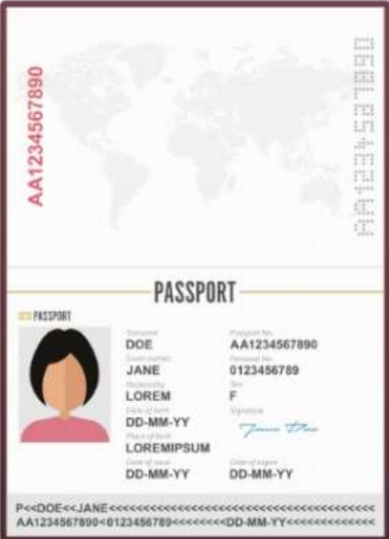
รูปถ่ายหน้าพาสปอร์ต