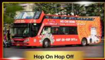
Hop On Hop Off