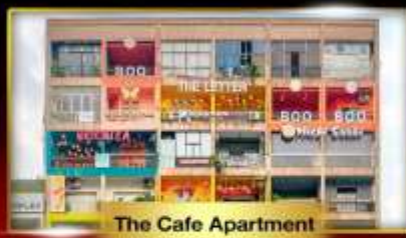
The Cafe Apartment