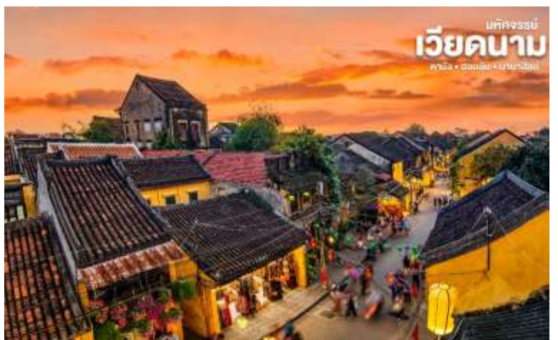
มหัศจรรย์ เวียดนาม ตานัง • ฮอยอัน • บานาฮิลล์

เมืองมรดกโลกทางวัฒนธรรมเนื่องจากเป็นสถานที่สำคัญทางประวัติศาสตร์ แม้ว่าจะผ่านการบูรณะขึ้นเรื่อยๆแต่ก็ยังคงรูปแบบของเมืองฮอยอันไว้ได้ นำท่านเดินทางด้วยรถโค้ชปรับอากาศเดินทางเข้าสู่ตัวเมืองฮอยอัน นำท่านชม วัดจีน เป็นสมาคมชาวจีนที่ใหญ่และเก่าแก่ที่สุดของเมืองฮอยอันใช้เป็นที่พักปะของคนหลายรุ่น วัดนี้มีจุดเด่นอยู่ที่งานไม้แกะสลักลวดลายสวยงามท่านสามารถทำบุญต่ออายุโดยพิธีสมัย์โบราณ คือ การนำรูปที่ขีดเป็นก้นหอย มาจุดทิ้งไว้เพื่อเป็นสิริมงคลแก่