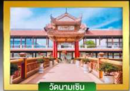
วัดนามเซิน