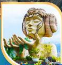
โมอาน่า ซาปา คาเฟ่