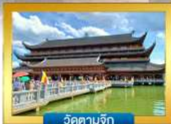
วัดตามจุก