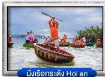
นั่งเรือกระดิง Hoi an