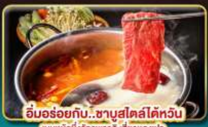
อิ่มอร่อยกับ...ชาบูสไตล์ไต้หวัน เมนูหม้อไฟจิ๋วพรีเมียม เสียวทงเป่า