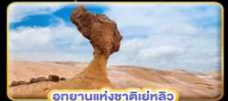
อุทยานแห่งชาติเยลโลว์