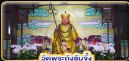
วัดพระถังซำจั๋ง

"ล่องเรือทะเลสาบสุริยันจันทรา" ขอความรักวัดหลงซาน