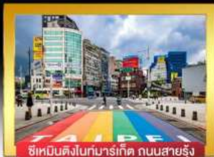
ซีเหมินติงไนท์มาร์เก็ต ถนนสายรุ้ง