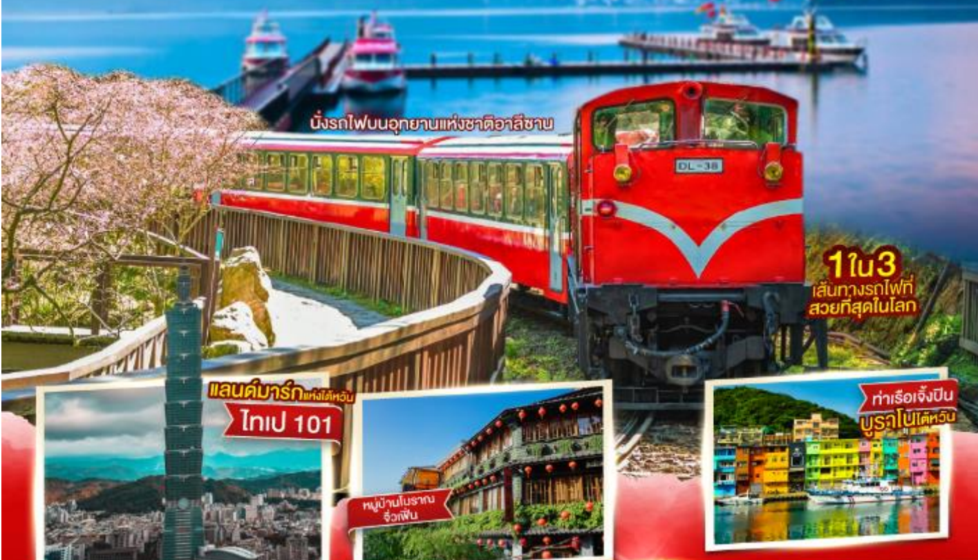
นั่งรถไฟบนอุทยานแห่งชาติอาลีซาน

ประกันอุบัติเหตุและอุบัติเหตุ คุ้มครองสูงสุด 3,000,000