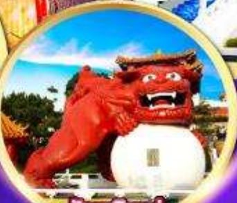
วัดเหวินทง