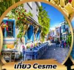
เที่ยว Cesme Alacati