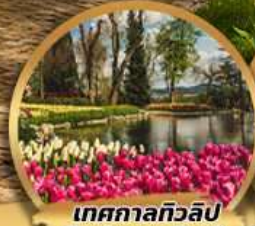
เทศกาลทิวลิป Emirgan Park

วันเดินทาง มี.ค - เม.ย. 2568 28 มี.ค. - 04 เม.ย. / 09 - 16 เม.ย. / 12 - 19 เม.ย.