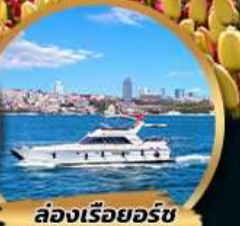
ล่องเรือออร์ซ บนช่องแคบบอสฟอรัส