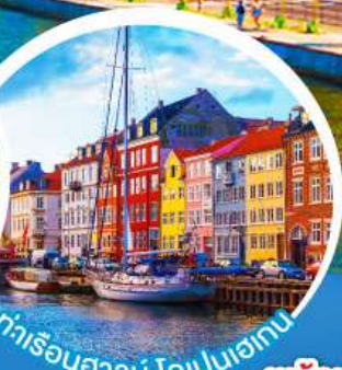
ท่าเรืออูวอน.โคเปนเฮเกน