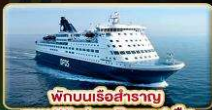
พักบนเรือสำราญ แบบ Window Room 1 คืน