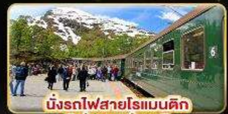
นั่งรถไฟสายโรแมนติก "ฟรอมสบาน่า"