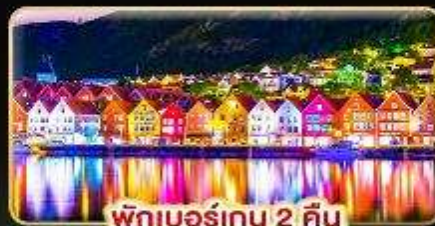
พักเบอร์เกน 2 คืน