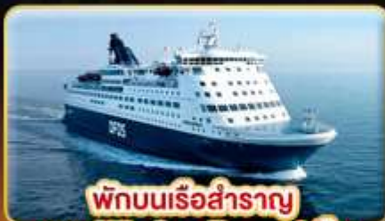
พักผ่อนเรือสำราญ แบบ Window Room 1 คืน