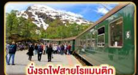
นั่งรถไฟสายโรแมนติก "ฟรอมสปานา"