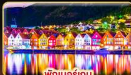
พักเบอร์เกน