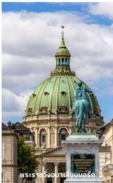
พระราชวังมาเลเซียนบอร์ก