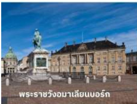
พระราชวังมาเลเซียนบอร์ก