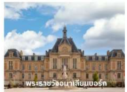
พระราชวังมาเลเซียนบอร์ก