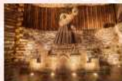
เหมืองเกลือวิลิชก้า