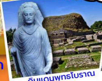
ดินแดนพุทธโบราณ ตักศิลา