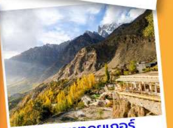
ยอดเขาดูยเกอร์