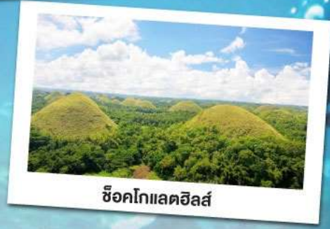
ช็อคโกแลตฮิลล์