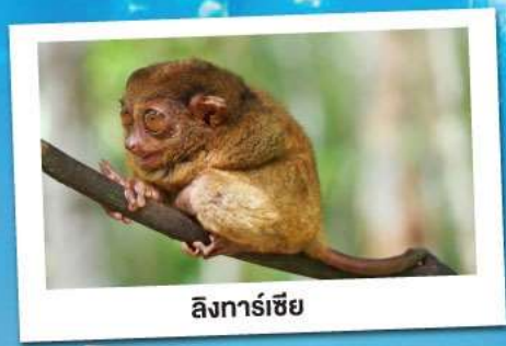
ลิงทาร์เซีย