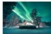
Glass Igloo Hotel

** พักที่ NORTHERN LIGHTS VILLAGE OR SIMILAR **