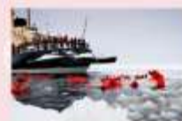
ล่องเรือตัดน้ำแข็ง Ice Breaker