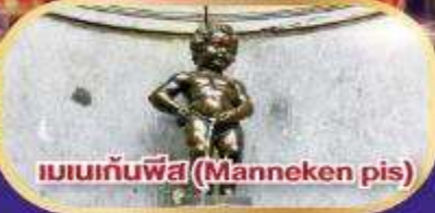
แมนเนกันพีส (Manneken pis)