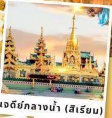
เจดีย์กลางน้ำ (สิริเยม)