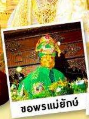
ขอพรแม่ยักย์