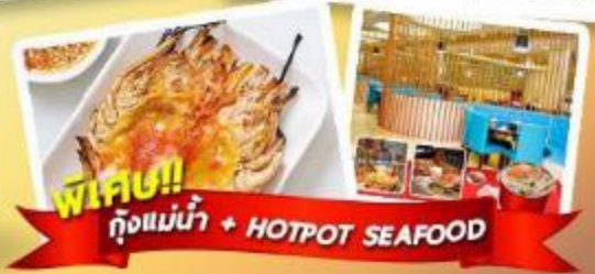
พิเศษ!! กุงแม่น้ำ + HOTPOT SEAFOOD