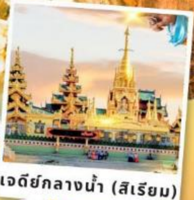
เจดีย์กลางน้ำ (สีเรียม)