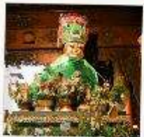
ขอพระแม่ยักษ์