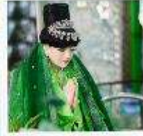
เทพกระซิบ