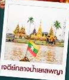
เจดีย์กลางน้ำเยเลพญา