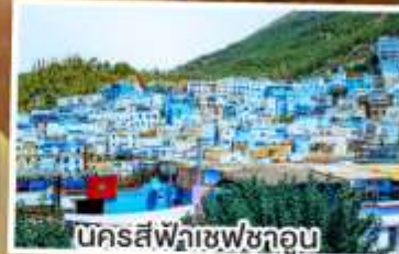
นครสีฟ้าชเฟซากูอน