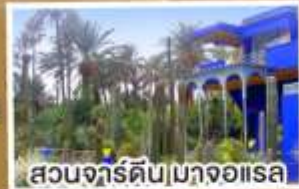
สวนจาร์ดิน|มาจออเรล