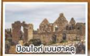
ป้อมโอท์ เบนฮาดดู