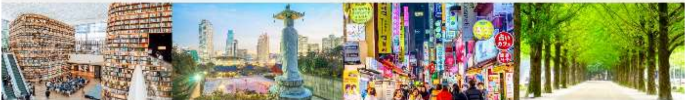
STARFIELD COEX MALL