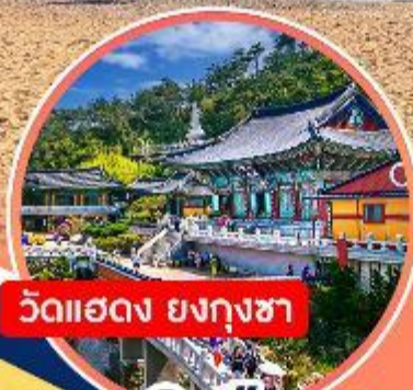
วัดแสดง ยงกุงซา