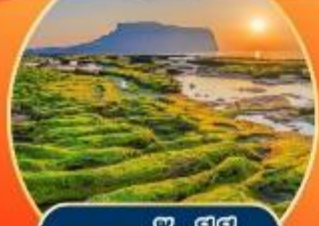
หาดควังซังกี