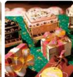
กล่องดนตรี MUSIC BOX