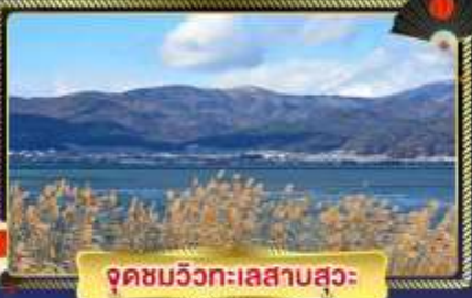
จุดชมวิวกะเลสาบสวะ