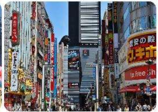
ช้อปปิ้งใจกลางกรุงโตเกียว - ซินจูกุ

นำพาทุกท่านเข้าสู่.. กรุงโตเกียว และช้อปปิ้งกันที่ใจกลางเมือง ซินจูกุ แหล่งรวมแฟชั่นและความบันเทิงย่านที่ไม่เคยหลับไหลและเต็มไปด้วยชีวิตชีวา และแหล่งช้อปปิ้งที่หลากหลาย เช่น Isetan และ Takashimaya ที่มีสินค้าหรูหราและแฟชั่นล่าสุด รวมถึงห้างสรรพสินค้าในตึกสูงอย่าง Tokyo Metropolitan Building เพลิดเพลินกับบรรยากาศที่สวยงามไสวของ Kabukicho ซึ่งเป็นย่านบันเทิงที่มีร้านอาหารมากมาย นอกจากนี้ยังมี Golden Gai ซึ่งเป็นย่านบาร์เล็กๆ ที่มีเสน่ห์และบรรยากาศที่เป็นเอกลักษณ์ และมีแลนด์มาร์คถ่ายรูปที่โด่งดังอย่าง แมวยักษ์ 3 มิติ (Giant 3D Cat)