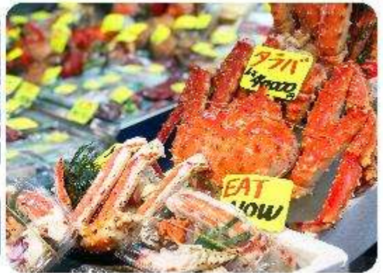
ตลาดปลาซึกิจิ

แนะนำที่เกี่ยว อิสระด้วยตัวเอง - ตลาดปลาซึกิจิ Tsukiji Outer Market ตลาดปลาชื่อมีชื่อเสียงของญี่ปุ่น และยังเป็นหนึ่งในตลาดปลาที่ใหญ่ที่สุดในโลกด้วยค่ะ ตั้งอยู่ในโตเกียว ตลาดแห่งนี้มีการซื้อขายอาหารทะเลมากกว่า 2,000 ตันต่อวัน โดยโซนภายในตลาดนั้นจะแบ่งออกเป็น 2 ส่วน ก็คือ ส่วนด้านนอก ที่มีร้านค้าปลีกและร้านอาหารอยู่เรียงรายให้เราได้เลือกซื้ออาหารทะเลสดๆ รับประทานกัน