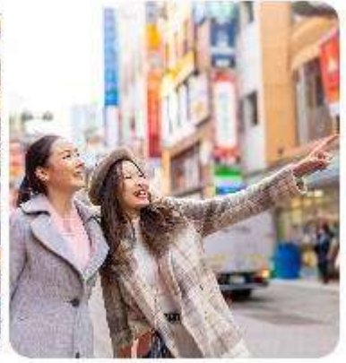
ช้อปปิ้งใจกลางกรุงโตเกียว