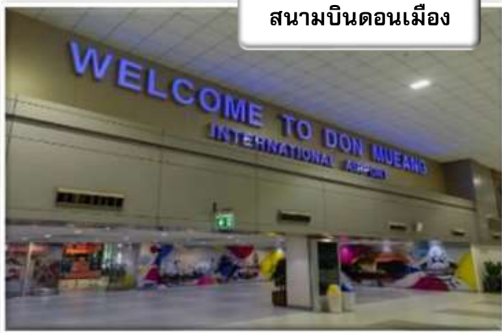
สนามบินดอนเมือง

เวลา 23.30 น. พร้อมกันที่ สนามบินดอนเมือง อาคารผู้โดยสารขาออกระหว่างประเทศเคาน์เตอร์ สายการบินไทยแอร์เอเชีย เอ็กซ์ เจ้าหน้าที่คอยให้การต้อนรับ ดูแลด้านเอกสาร เช็คอิน และสัมภาระในการเดินทาง