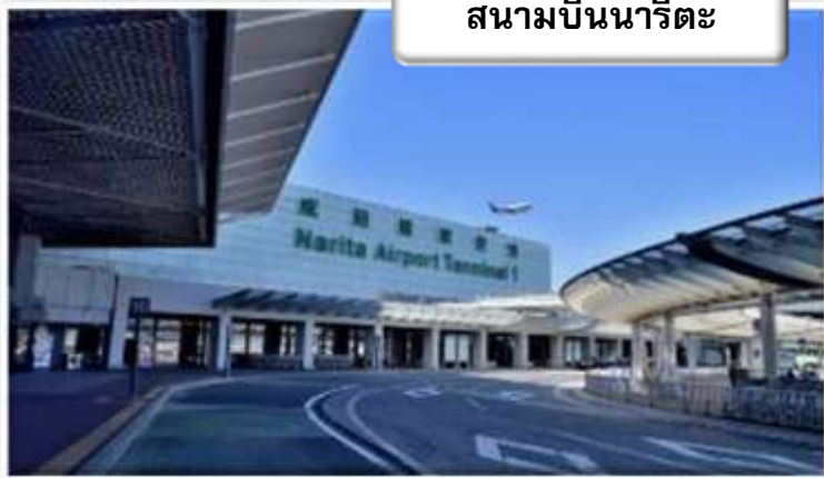
สนามบินนาริตะ

เวลา 02.25 น. ออกเดินทางสู่ สนามบินนาริตะ ประเทศญี่ปุ่น โดย สายการบินไทยแอร์เอเชียเอ็กซ์ เที่ยวบินที่ XJ 602