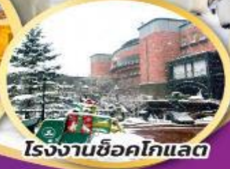
โรงงานช็อคโกแลต