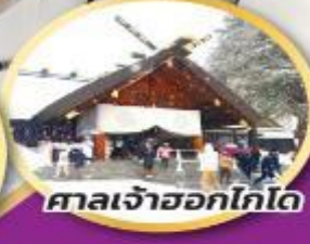
ศาลเจ้าออกโทโด

ชมความน่ารักของน้องๆ ที่สวนสัตว์อาซาฮิยาม่า