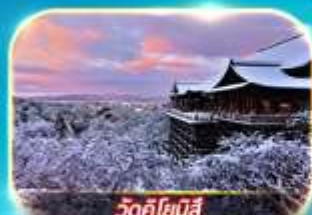
วัดคิโยมิตสึ