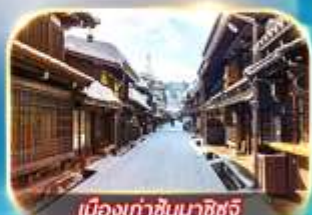
เมืองเก่าชินมาชิซูจิ