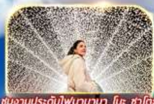
ชมงานประดับไฟนาฮานา ในะ ซาโตะ