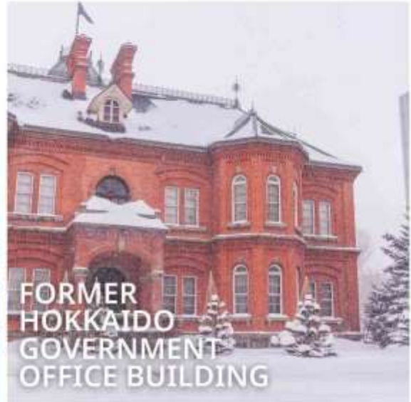
FORMER HOKKAIDO GOVERNMENT OFFICE BUILDING