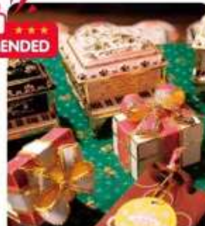
กล่องดนตรี MUSIC BOX