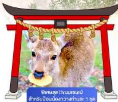
พิเศษสุด!! ชมเมฆเมเปิ้ล สำหรับบือนเมืองกวางาโน่ 1 จุด