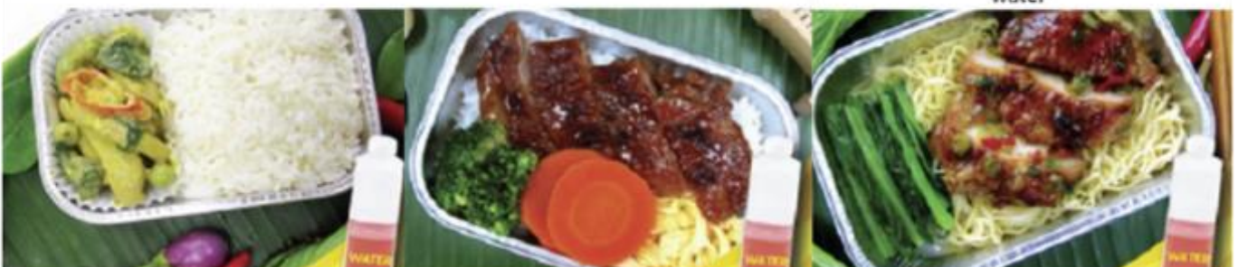
Chicken roasted with herb and noodle and water