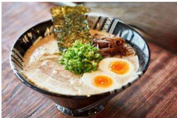
ฮากาตะราเมง (Hakata Ramen)