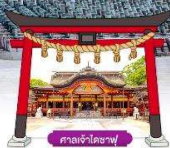
ศาลเจ้าโคซาฟุ