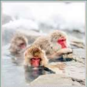
"SNOW MONKEY PARK"