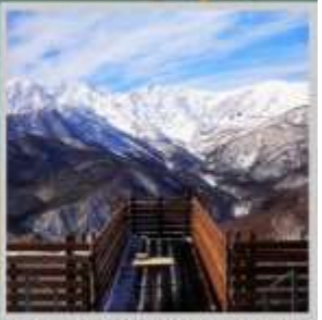
"HAKUBA MOUNTAIN HARBOR"