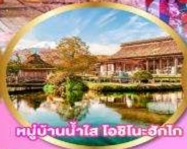
หมู่บ้านน้ำใส โอชิโนะฮักโก