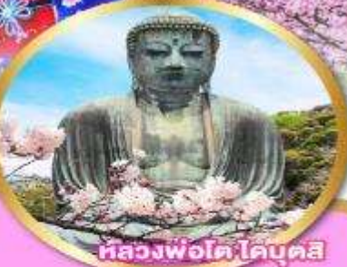
หลวงพ่อดำ โคบุตสึ