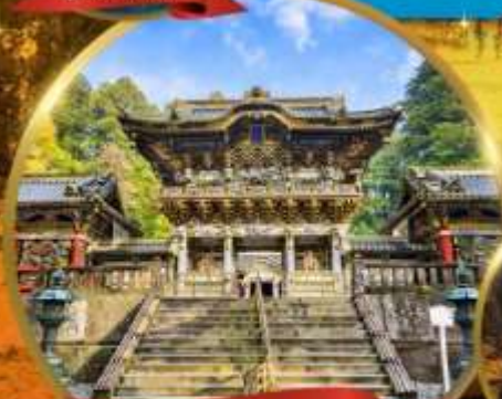
ศาลเจ้านิกโกโทโฮกุ