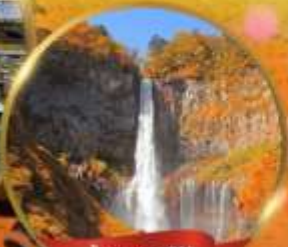
น้ำตกเคกอน