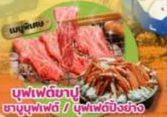
บุฟเฟ่ต์ชาปู ชาบูบุฟเฟ่ต์ / บุฟเฟ่ต์บิงชัง