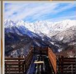
"HAKUBA MOUNTAIN HARBOR"

**ราคาทัวร์ดังกล่าวรวมค่าธรรมเนียมที่พักแล้ว